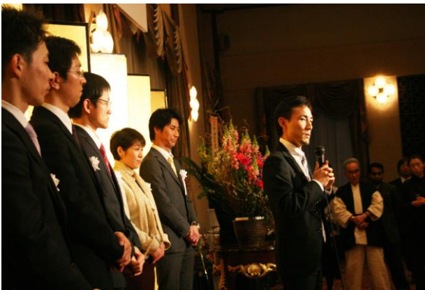
想いを継ぐ各地の実行委員長たち