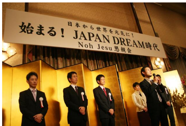
JMP 全国実行委員長と各地域の JMP 実行委員長たち