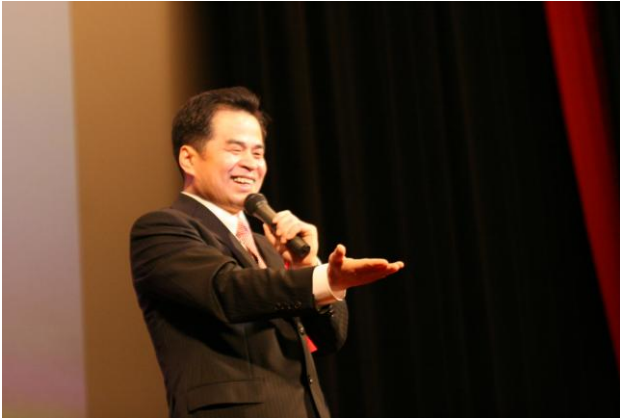
④ 始まる！JAPAN DREAM 時代 (Noh Jesu)