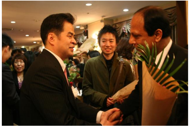
実行委員・協力店・協賛者の皆様と交流