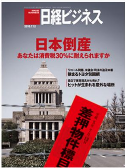
上: [日経ビジネス] 2010年7月12日号 右: [朝日新聞 朝刊] 2010年3月7日付

JMP 第 5 弾(2010/3/6)の講演会にて、参加者の国会議員やマスコミ関係者に向けて、「今、どこにフォーカスを当てるのか？日本全体の意識をどこに向けるのか？」が重要。正しい問題意識を持たねば、皆知らぬ間に国は滅びてゆく」と講演、「もし日本が潰れたら、マスコミが責任を取るべきだ！」と喝破。翌日(3/7)の朝日新聞を皮切りに、数多の新聞・雑誌上で“国家破綻”に関する話題がオープンになり、日本の行く末にかかる議論に一石を投じました。