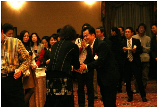
なごやかな懇親会の様子